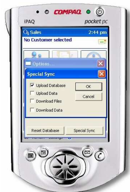
O4 las soluciones O4 tienen una capacidad de sincronización tal que permite copiar la base de datos móvil desde el usuario remoto hacia una ubicación central de administración, para que se

O4 WorkBench proporciona poderosos controles de administración al usuario final para el desarrollo de la aplicación. Los usuarios móviles pueden ser asignados a grupos, con permisos y accesos controlados, y la información del usuario se puede cambiar o puede ser actualizada como se requiera. Los atributos específicos se