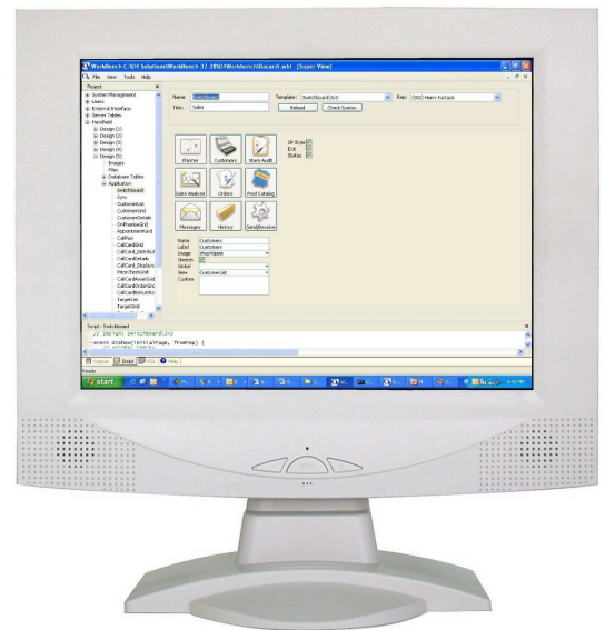
O 4 Workbench es un ambiente completo de escritorio para construir, personalizar, integrar, desarrollar y soportar aplicaciones móviles.

La O 4 WorkBench incorpora una "librería" con las best-practice de los procesos y operaciones en terreno que se pueden agregar continuamente con cada liberación de release o upgrade